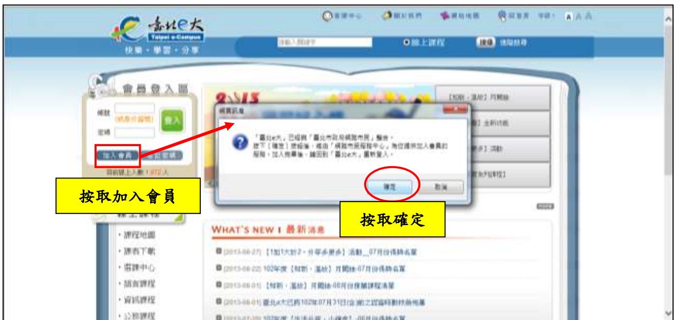
圖 2 加入會員

註：由於台北 e 大與台北市政府網路市民資訊整合，因此前往「網路市民服務中心」進行加入會員。