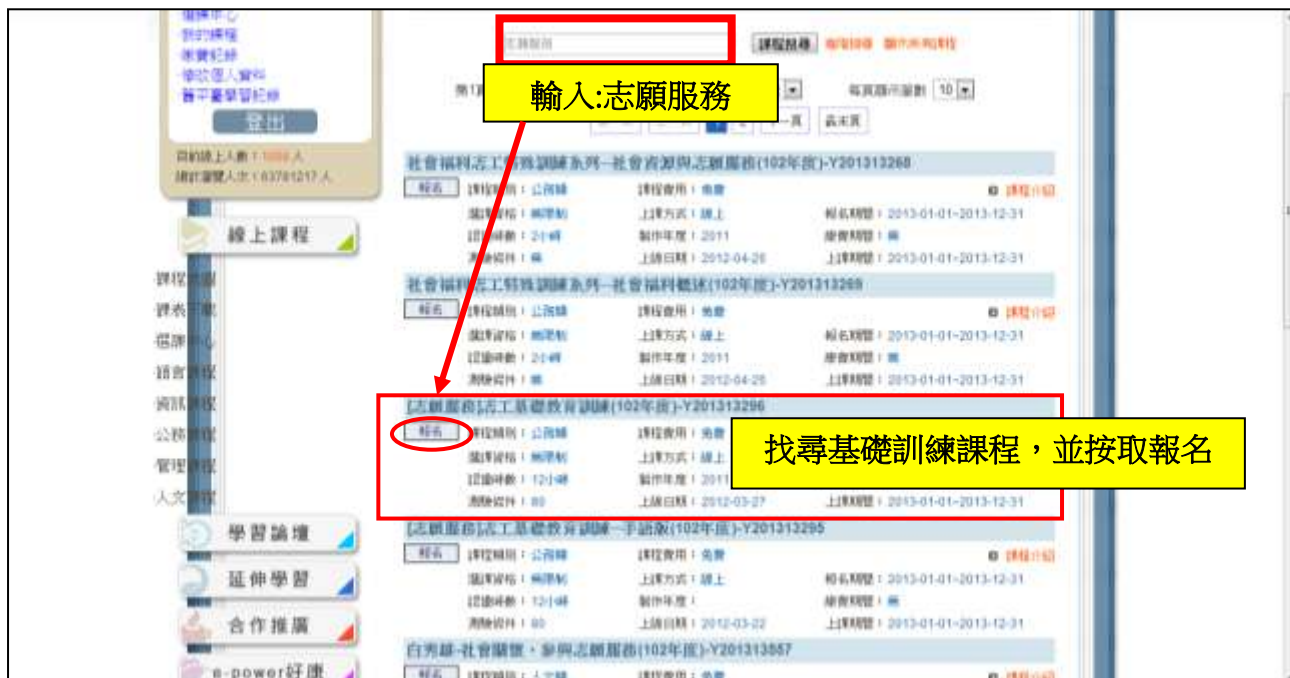
圖 9 輸入「志願服務」搜尋課程，並報名「『志願服務』志工基礎教育訓練(102 年度)」

請再次確定報名「『志願服務』志工基礎教育訓練(102 年度)」的課程(圖 10)。