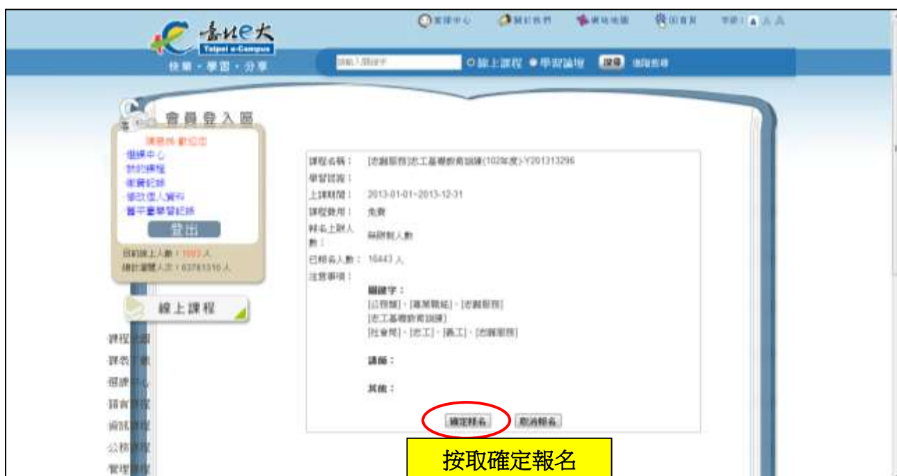
圖 10 確定報名此課程

請再次確定報名「『志願服務』志工基礎教育訓練(102 年度)」的課程(圖 10)。