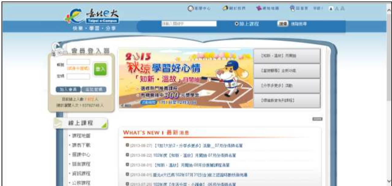
圖 1 台北 e 大學習網頁頁面

A：首先，請在 Internet Explorer 6.0 瀏覽器(以免視窗阻擋)搜尋「台北 e 大學習網」(https://elearning.taipei.gov.tw/)，打開頁面如圖 1 所示。